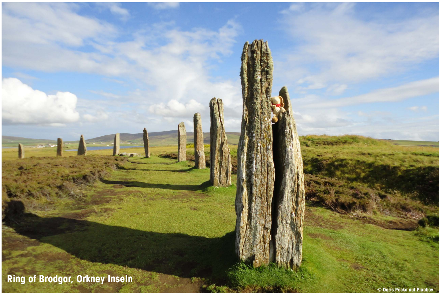
Ring of Brodgar, Orkney Inseln