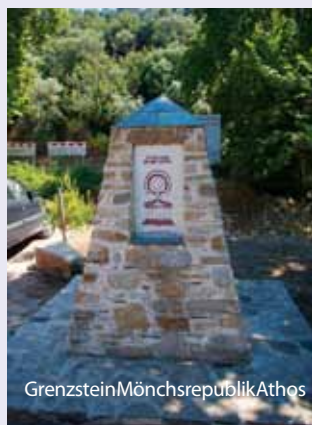
Grenzstein Mönchsrepublik Athos

Am Ortseingang von Ouranopolis, dem Grenzort zur autonomen Mönchsrepublik Athos und nur durch die kleine Uferstraße vom Strand getrennt. Von Ouranopolis fahren in der Saison Schiffe mit denen Athos umrundet werden und man einen Blick auf die Klöster werfen kann. Pyrgos ist eine schön, aus Natustein gestaltete, kleine Hotelanlage mit 28 Zimmern, jeweils ca 20qm groß, Minikühlschrank, möblierter Balkon (teilweise mit Meerblick), Klimaanlage und SAT-TV. Ein Swimmingpool mit Liegen und Sonnenschirmen (am Strand gegen Gebühr) sowie Poolbar.